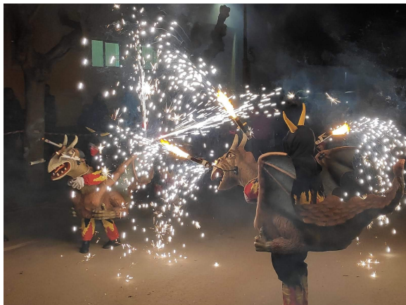
En Vi i La Brot de Montmeló