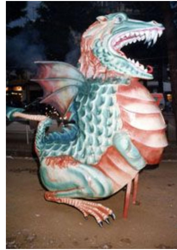
Drac de Vilardell (Sant Celoni)