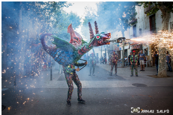
Drac Petit de la Geltrú