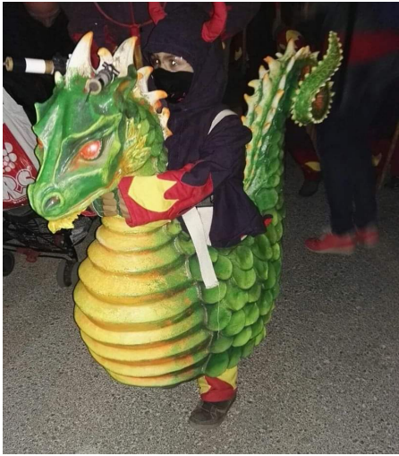
Dragonet de Vilardell (Sant Celoni)