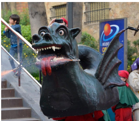
Drac infantil de Terrassa