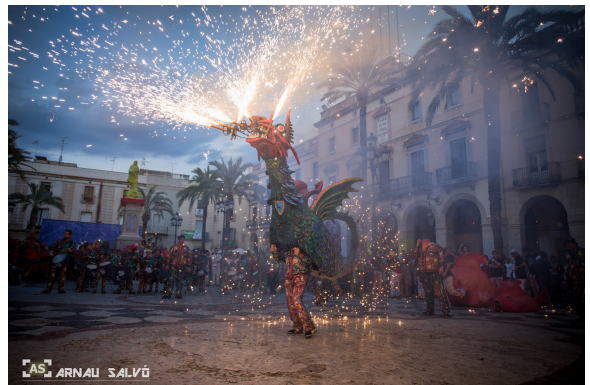
Drac de la Geltrú